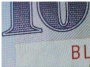
鑑定郵票/字畫/鈔票等